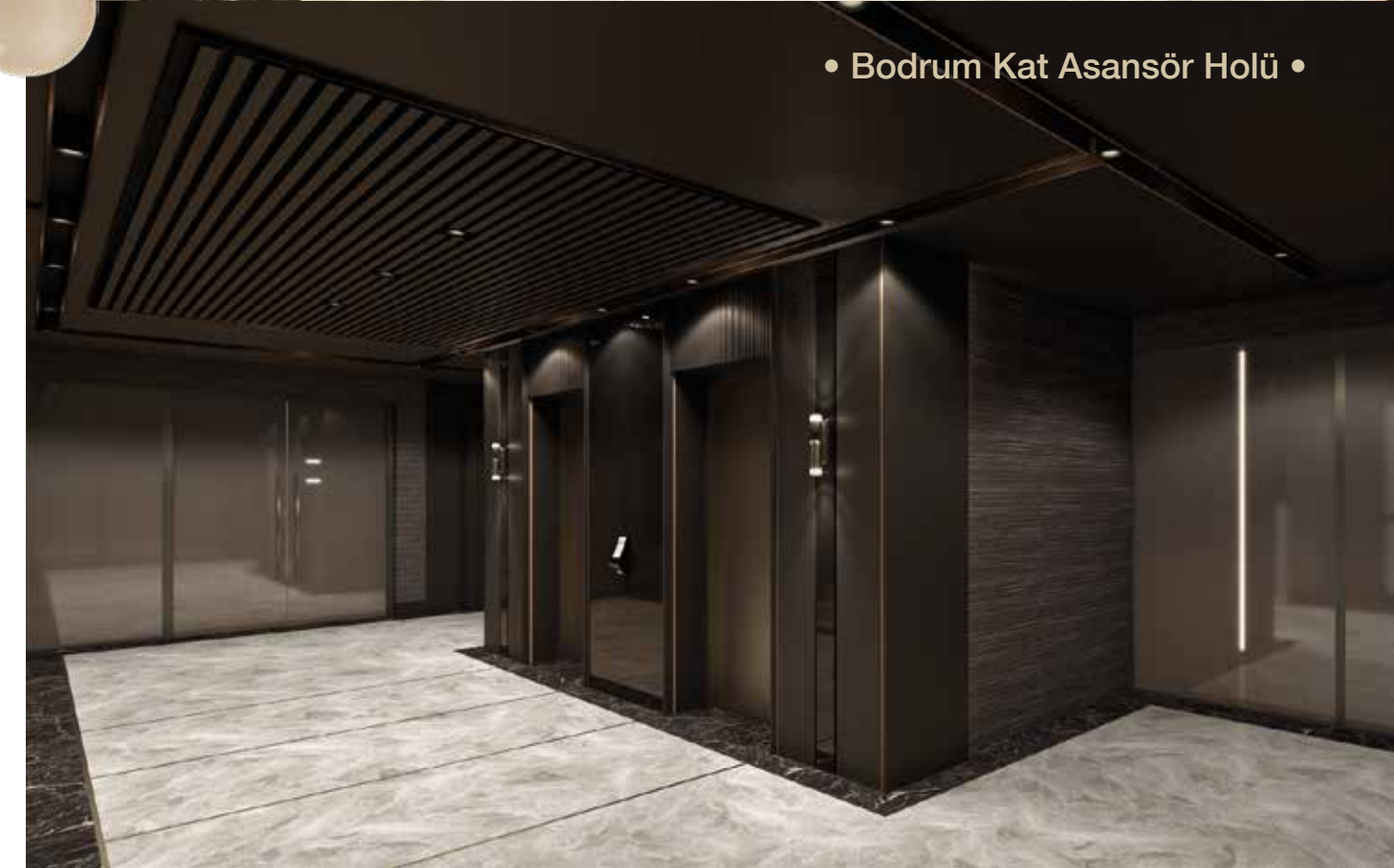
• Bodrum Kat Asansör Holü •