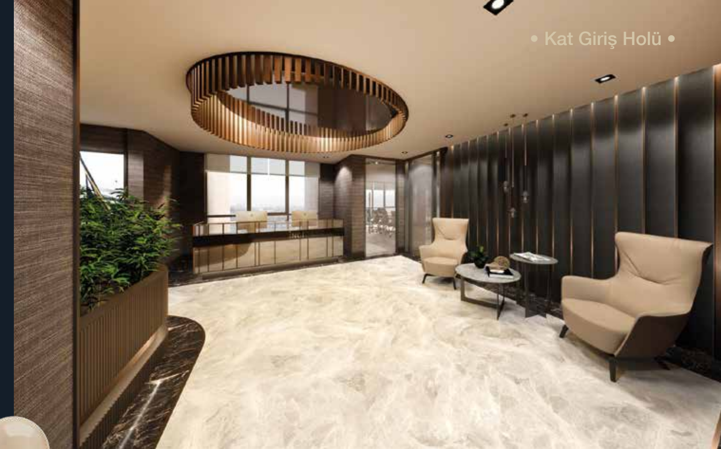
• Kat Giriş Holü •

İnci Ofis, gün boyunca doğal ışık alan aydınlık ve ferah ofisler, geniş çalışma alanları tasarlayarak sağlıklı ve verimli bir iş ortamının eksiksiz alt yapısını sizlere sunuyor.